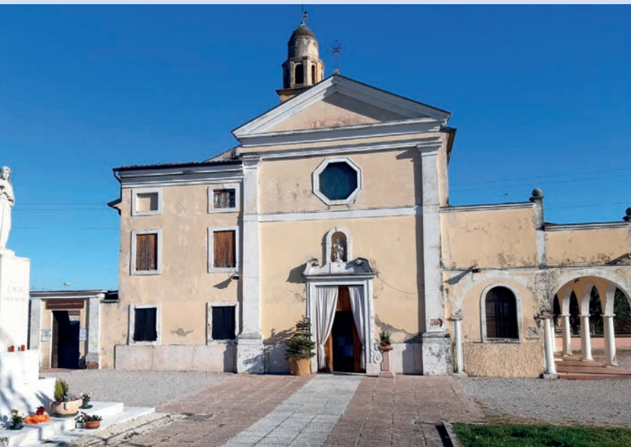
A SINISTRA: PELLALOCO (MN), SANTUARIO DI SANTA RITA DA CASCIA