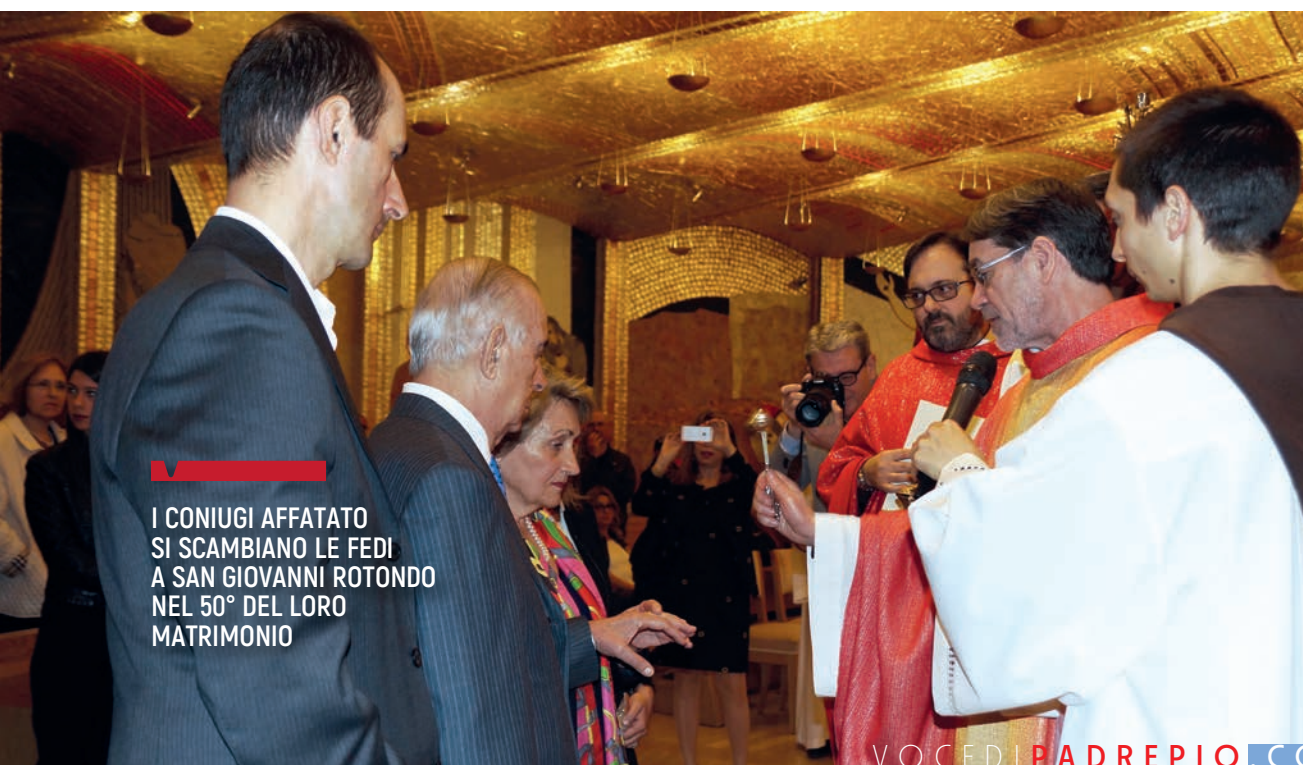
I CONIUGI AFFATATO SI SCAMBIANO LE FEDI A SAN GIOVANNI ROTONDO NEL 50° DEL LORO MATRIMONIO