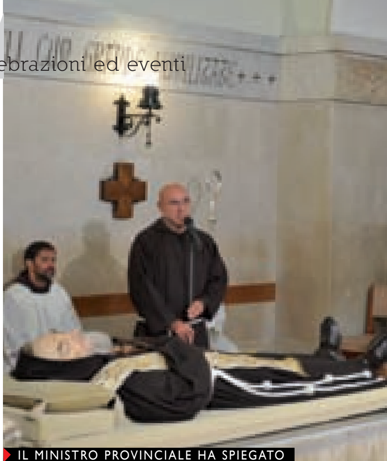
► IL MINISTRO PROVINCIALE HA SPIEGATO IL MOTIVO DELLA CHIUSURA DEL CORPO. ◀